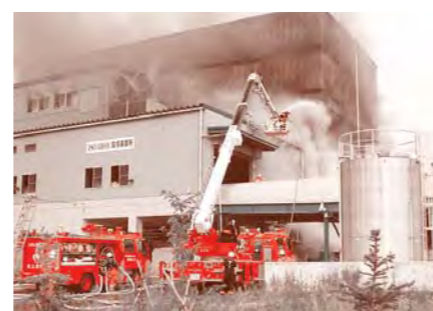
3消防本部との連携 (奥州消防との連携した現場活動)