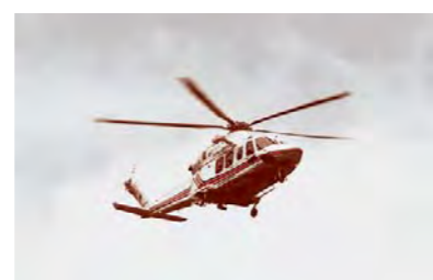
広域災害への対応 (平成28年機体更新した岩手県防災ヘリコプターひめかみ)