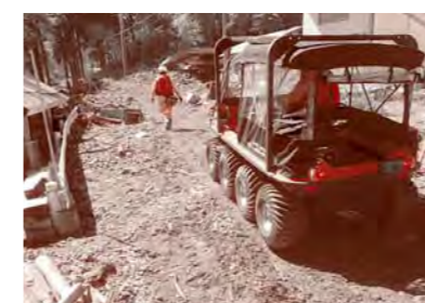
大規模災害への対応 (平成28年台風10号による岩泉町での活動)