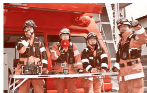
指令センターと交信する指揮隊