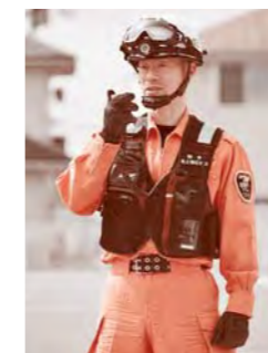
無線交信する隊員