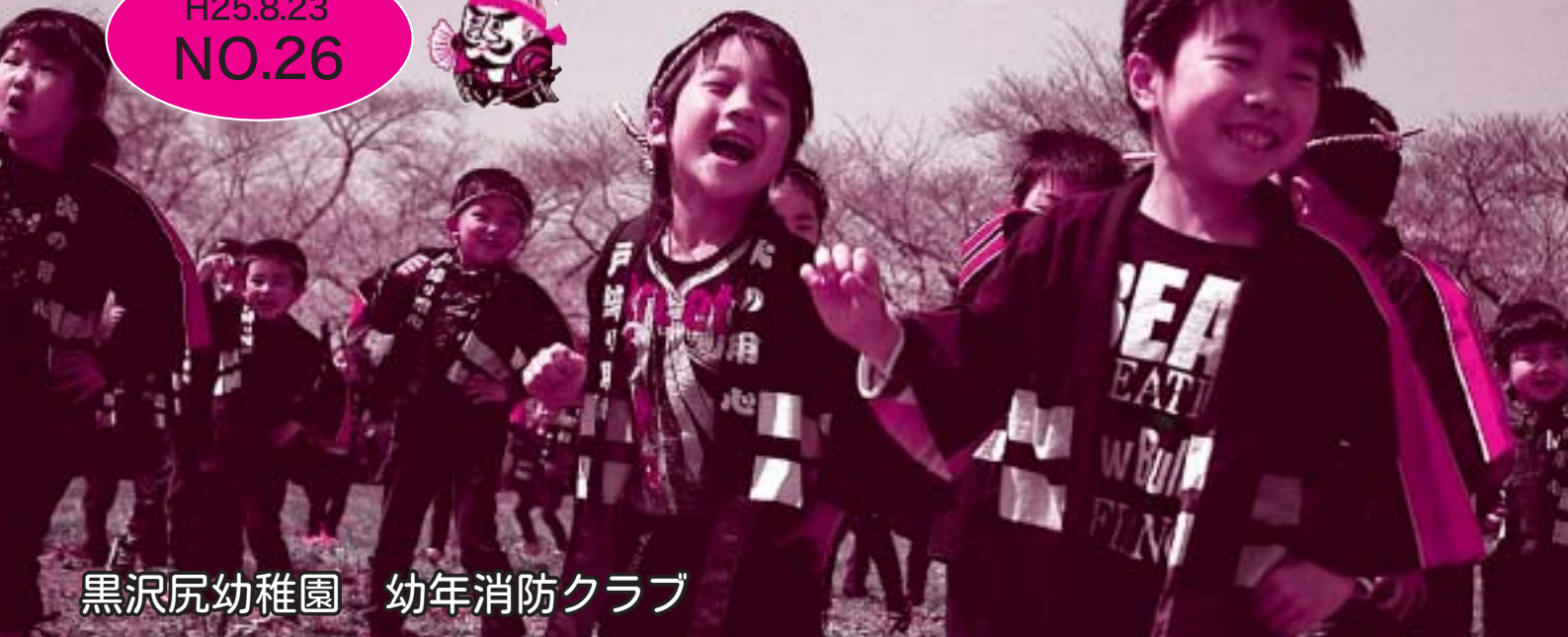
黒沢尻幼稚園 幼年消防クラブ