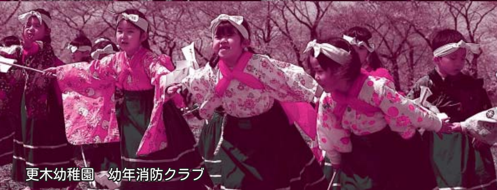
更木幼稚園 幼年消防クラブ