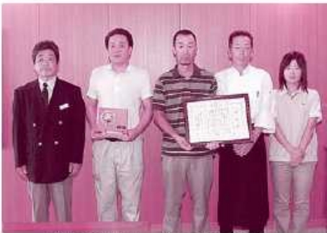
北上カントリークラブの支配人と救命活動を行った皆さん