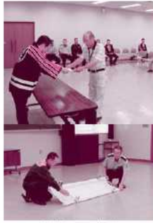
交付式と取扱説明

この事業は、(財)岩手県消防協会北上地区支部が平成18年度から実施しており、すべての組織に交付されるまで継続する予定です。