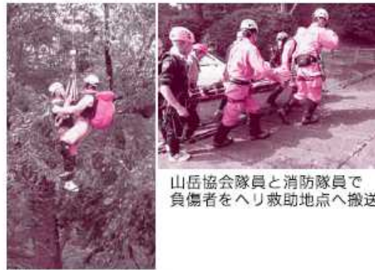
山岳協会隊員と消防隊員で負傷者をヘリ救助地点へ搬送

傷事故が多く防災ヘリ「ひめかみ」による捜索や負傷者収容の回数が多いことから、各団体との連携を図り速やかな負傷者等の救助及び搬送をすることを目的に実施されました。