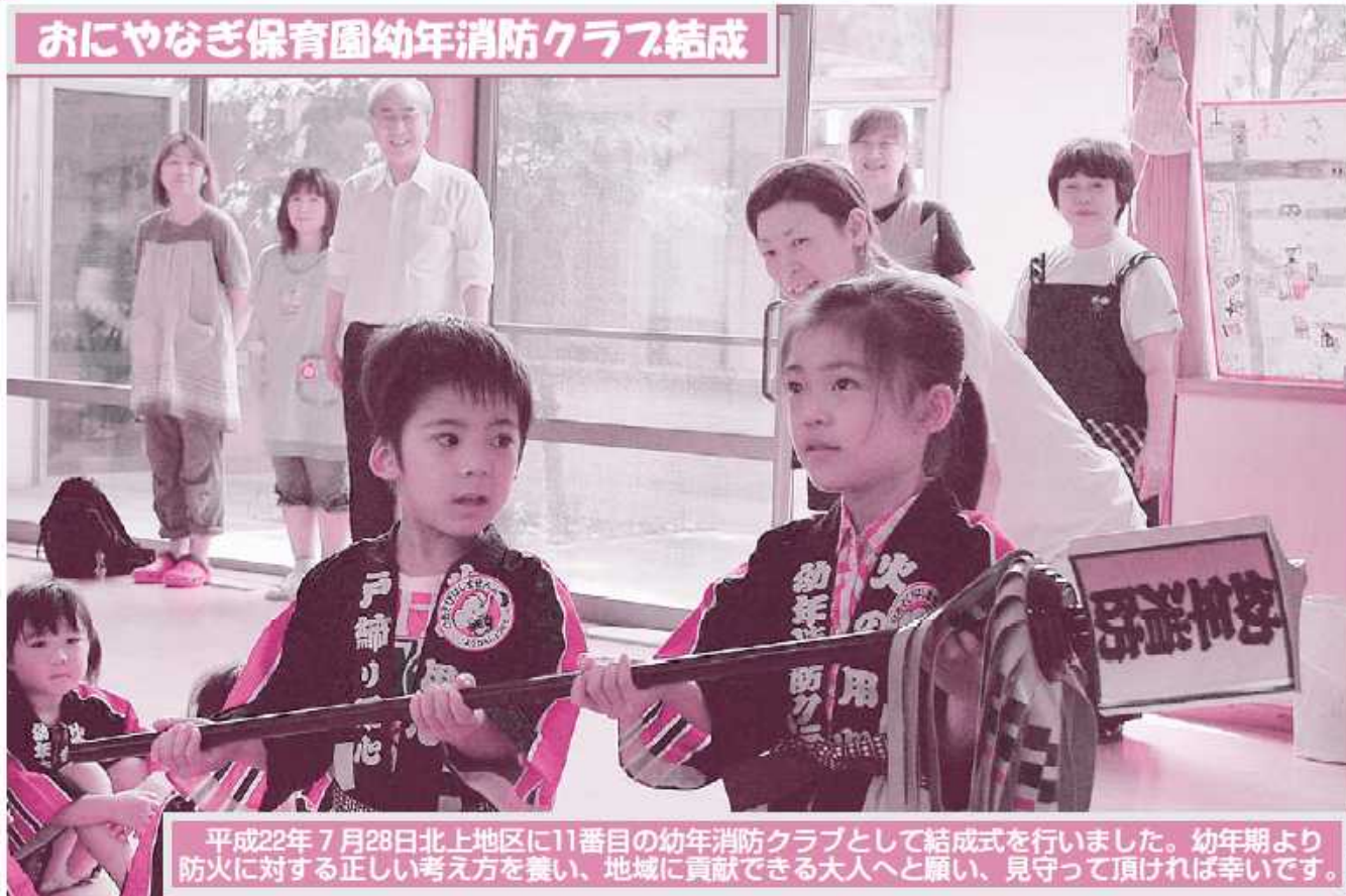
平成22年7月28日北上地区に11番目の幼年消防クラブとして結成式を行いました。幼年期より防火に対する正しい考え方を養い、地域に貢献できる大人へと願い、見守って頂ければ幸いです。