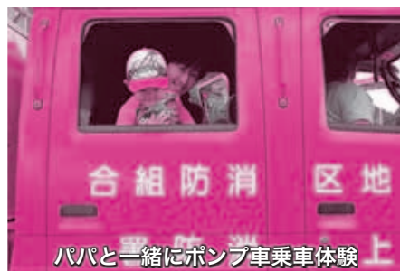
パパと一緒にポンプ車乗車体験