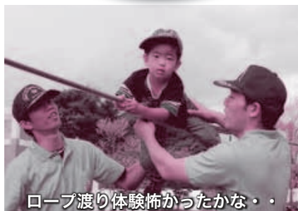
ロープ渡り体験怖かったかな・・・