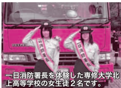
一日消防署長を体験した専修大学北上高等学校の女生徒2名です。