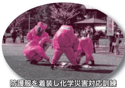
防護服を着装し化学災害対応訓練