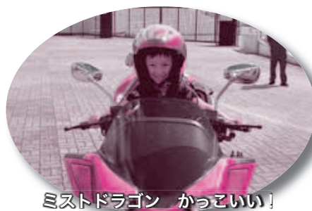
ミスドラゴン かわいい！