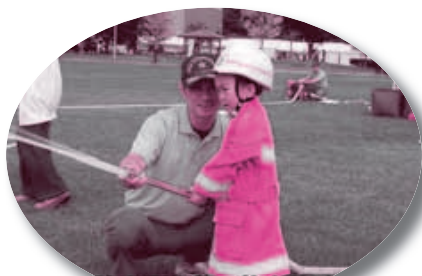
防火衣を着て放水体験

九月十三日（日）、北上総合運動競技場にて消防フェスタ2009を行いました。放水体験コーナーや、はしご車搭乗体験コーナーなど様々なコーナーを企画し、当日は約3000人の来場者にお越しいただきました。フェスタの様子をスナップ写真で紹介いたします。