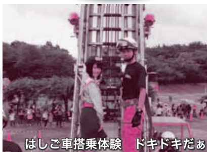
はしご車搭乗体験 ドキドキだあ