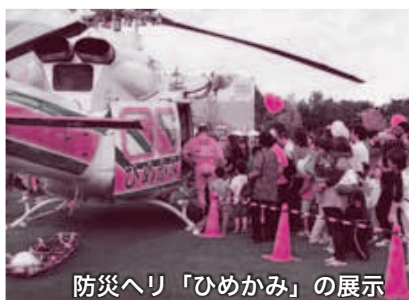
防災ヘリ「ひめかみ」の展示