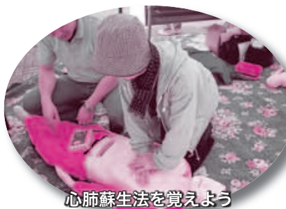
心肺蘇生法を覚えよう