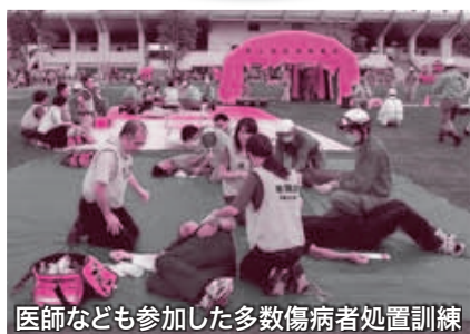
医師なども参加した多数傷病者処置訓練